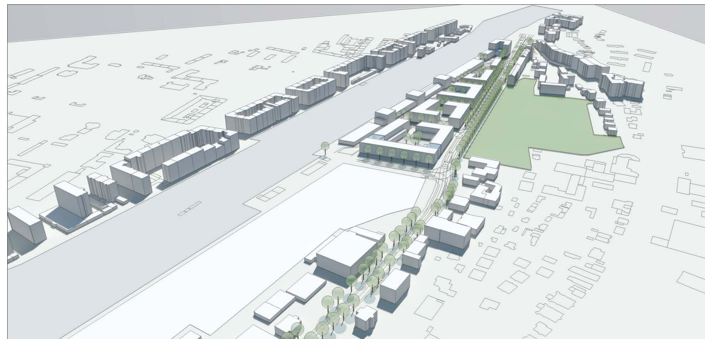
Vogelperspektive nach Süden