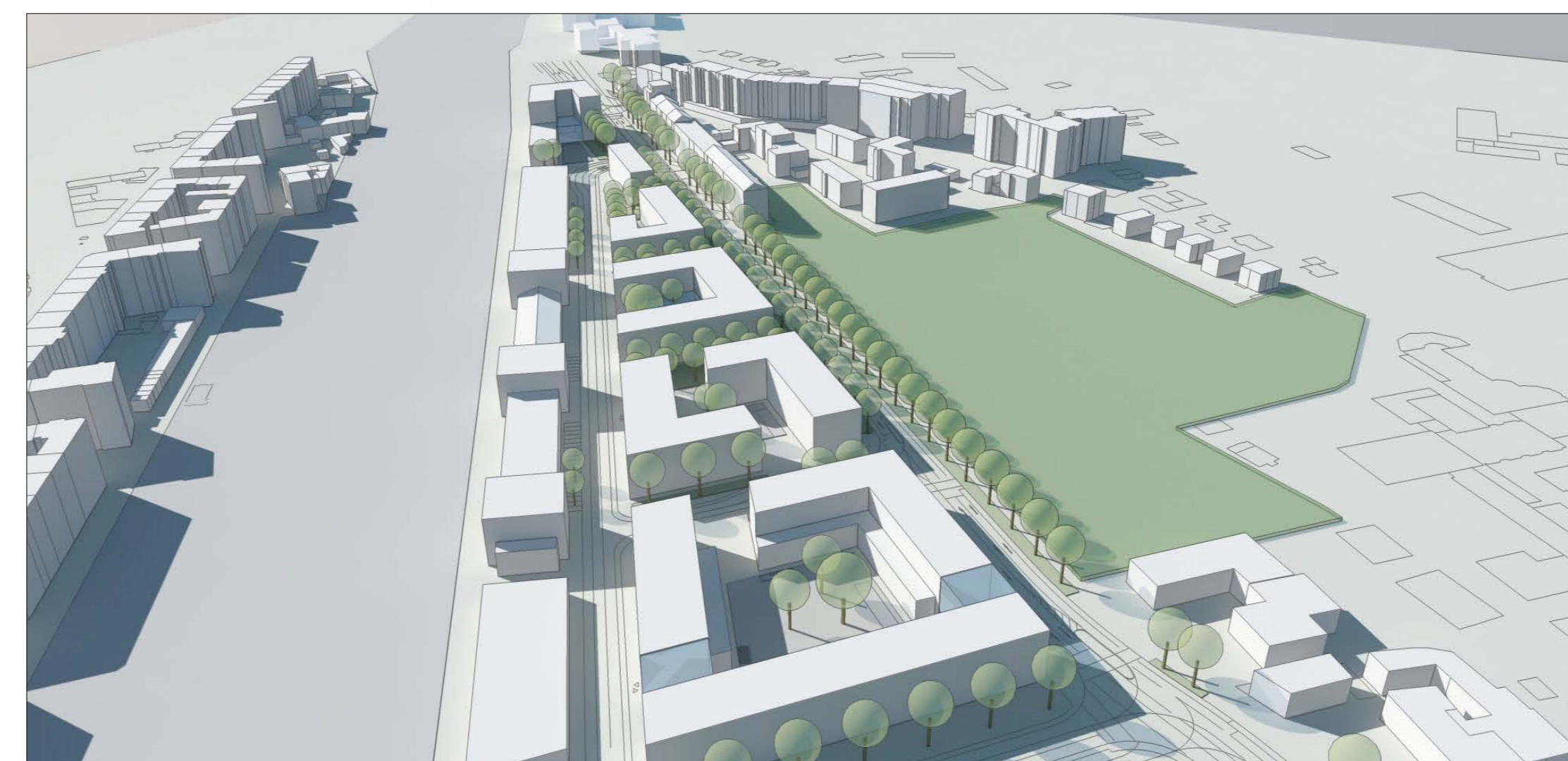
Blick von Norden auf das Planungsgebiet