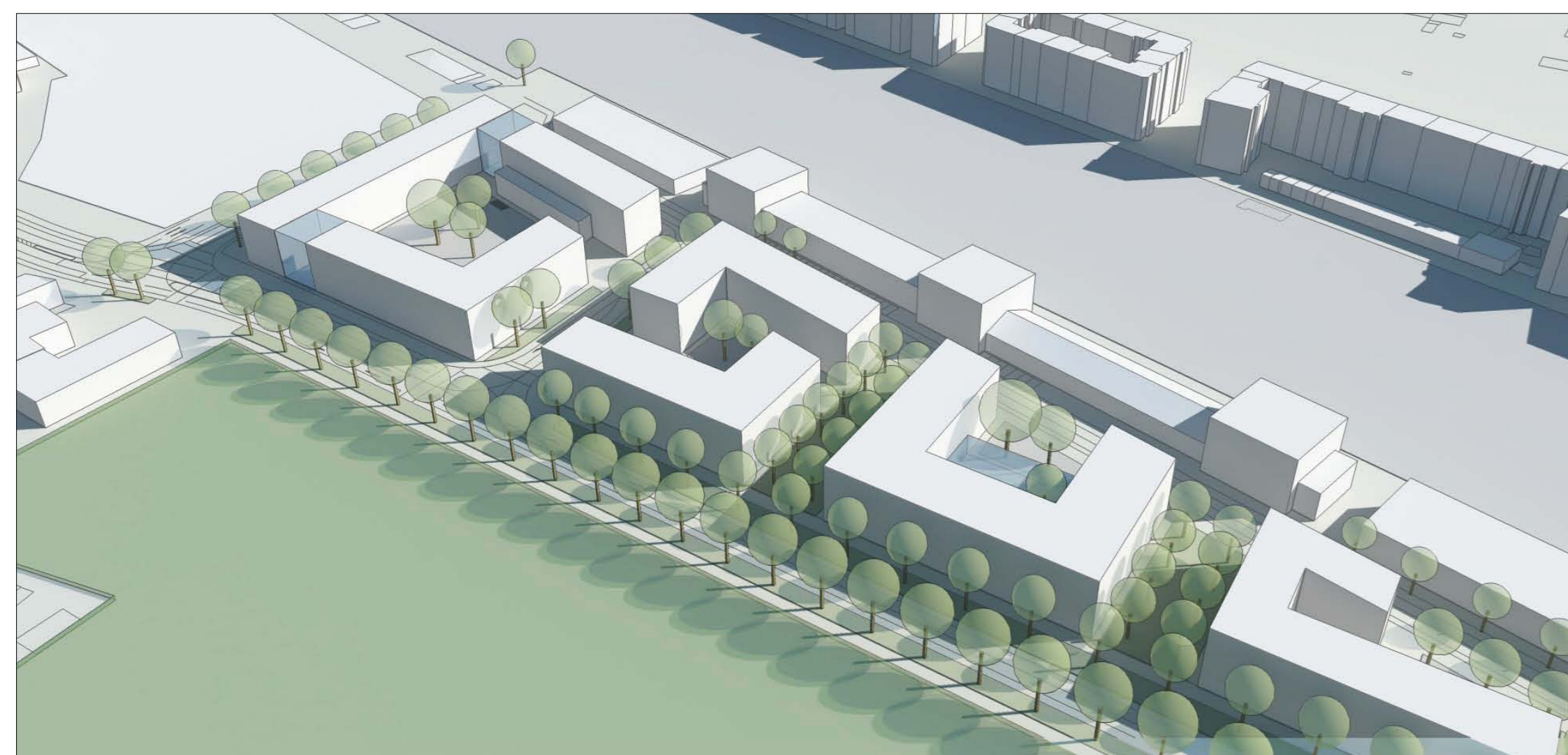
Blick von Westen auf das Plangebiet