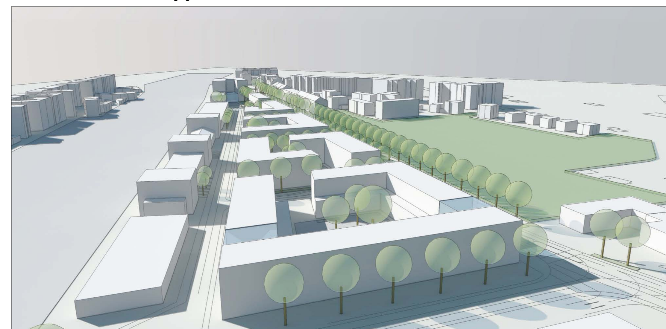
Blick von Norden im Bereich der rückwärtigen Erschließungsstraße (shared space) auf das Planungsgebiet