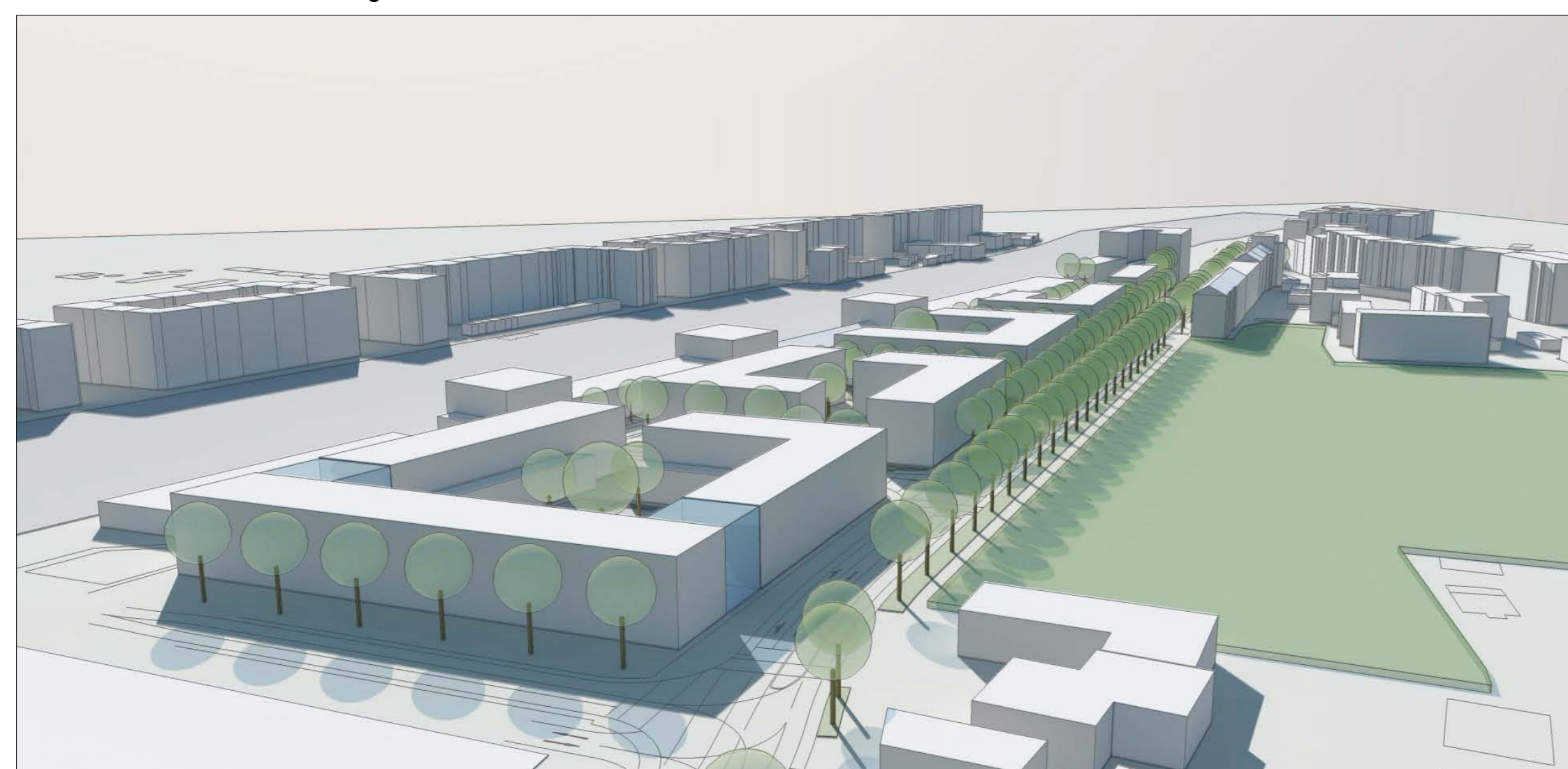
Blick Ecke Goethe-Unterführung / Mombacher Straße auf das Planungsgebiet