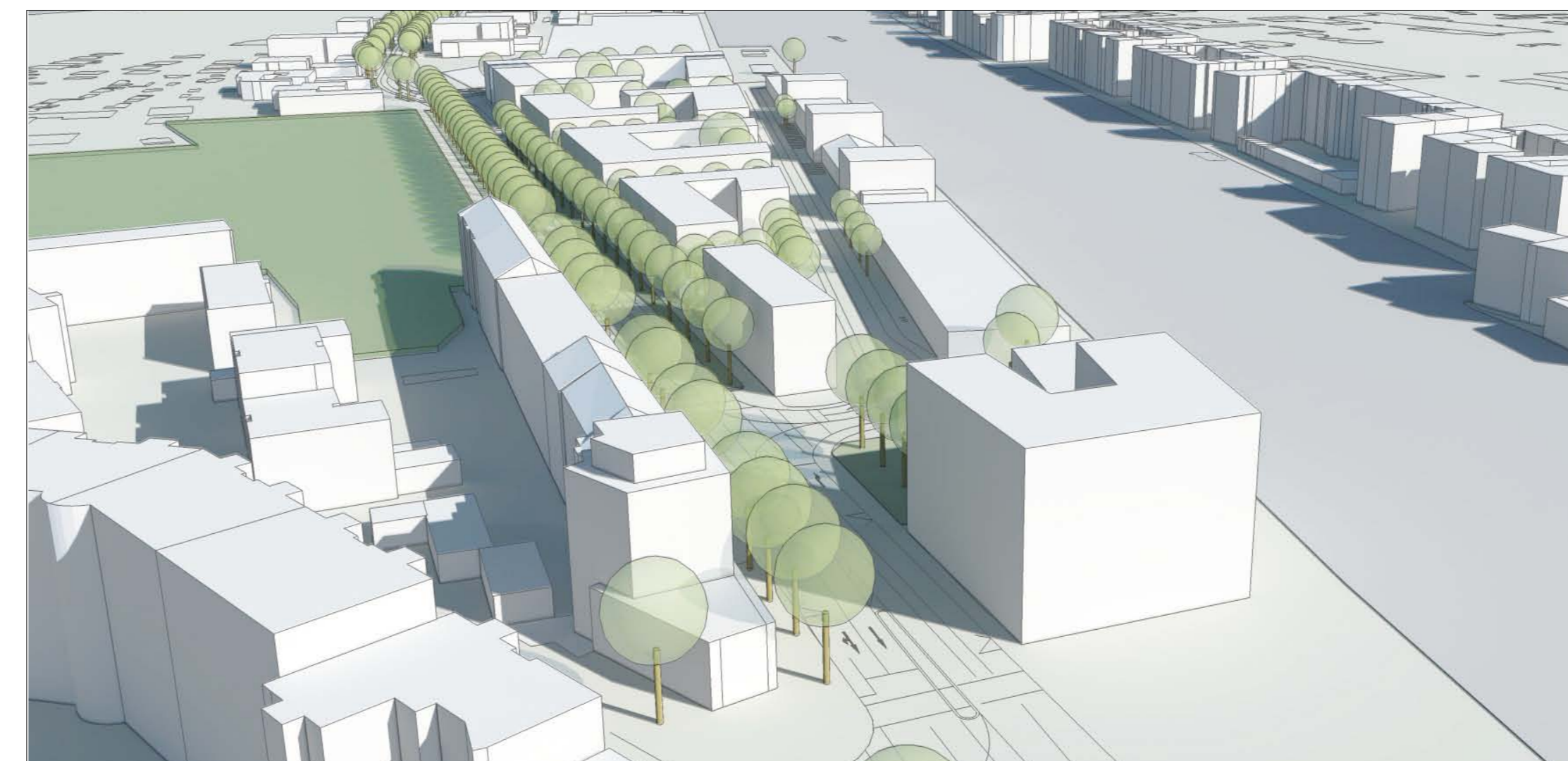
Blick von Süden auf das Planungsgebiet