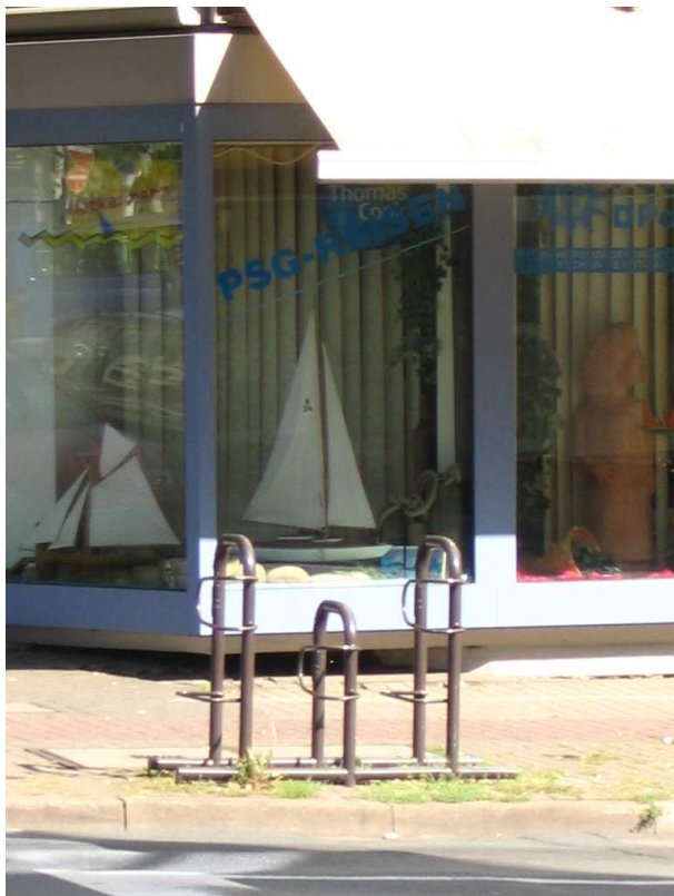
Beispiel eines Modells (Farbe und Breite kann abweichen)