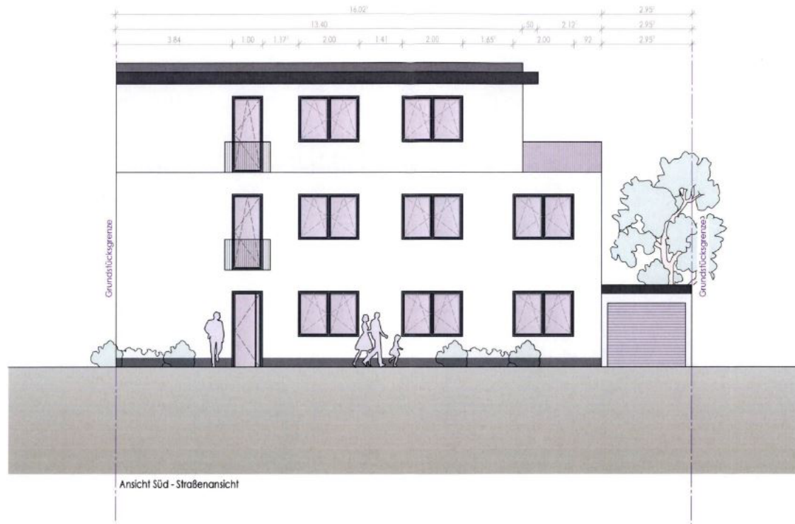
Ansicht Süd - Straßenansicht