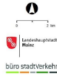
Abb. 6-14 Verkehrsverflechtungen im Radverkehr innerhalb der Stadt Mainz 21 (Auswertung auf Wegebene, Hochrechnung auf die Gesamtbevölkerung)