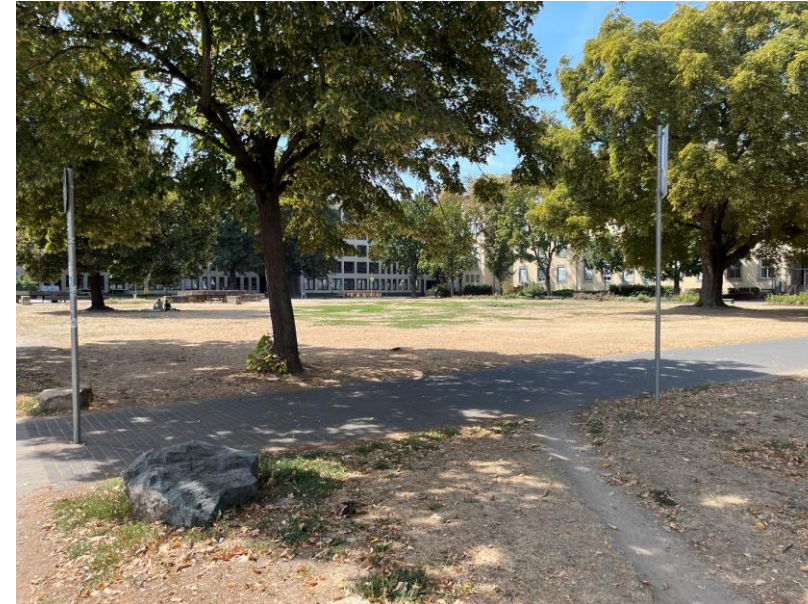
Blick über den Ernst-Ludwig-Platz im Sommer 2022