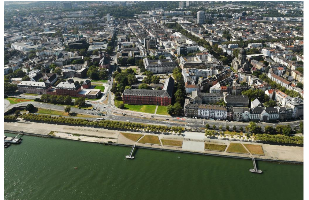
Regierungsviertel im Jahr 2007