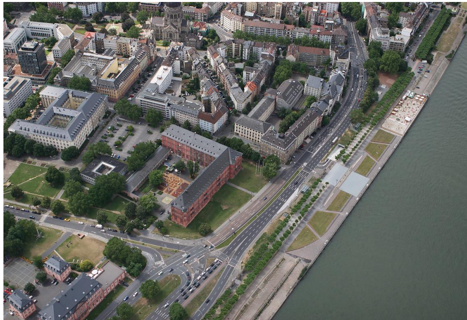
Regierungsviertel im Jahr 2007

30.11.2022 - Stadtrat Beschluss zur Neuauflage Forum Regierungsviertel 2023