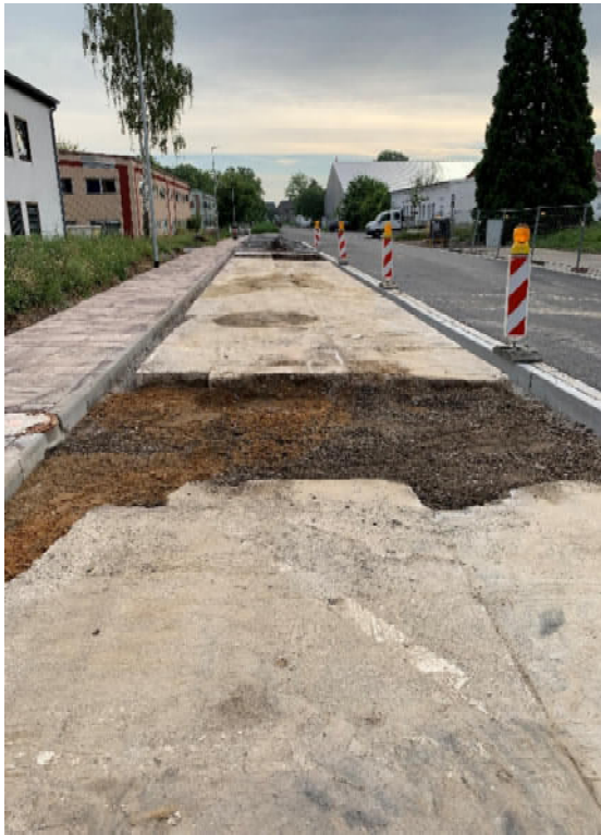
Ertüchtigung Parkplatzflächen vor Geb. 5856