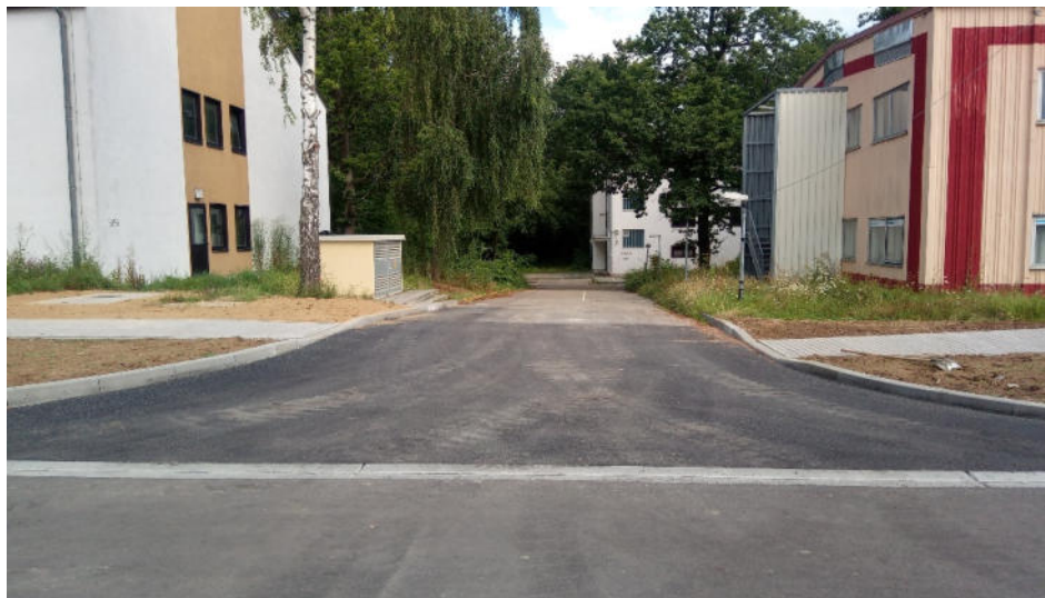
Neu hergestellte Abfahrt zum Geb. 5876