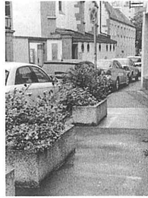
Derzeitiger Zustand der Kapuzinerstraße. Parkende Autos