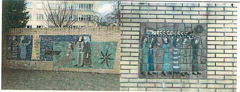
„Schlüssel des Stundenschlägers“ in der Taunusstraße