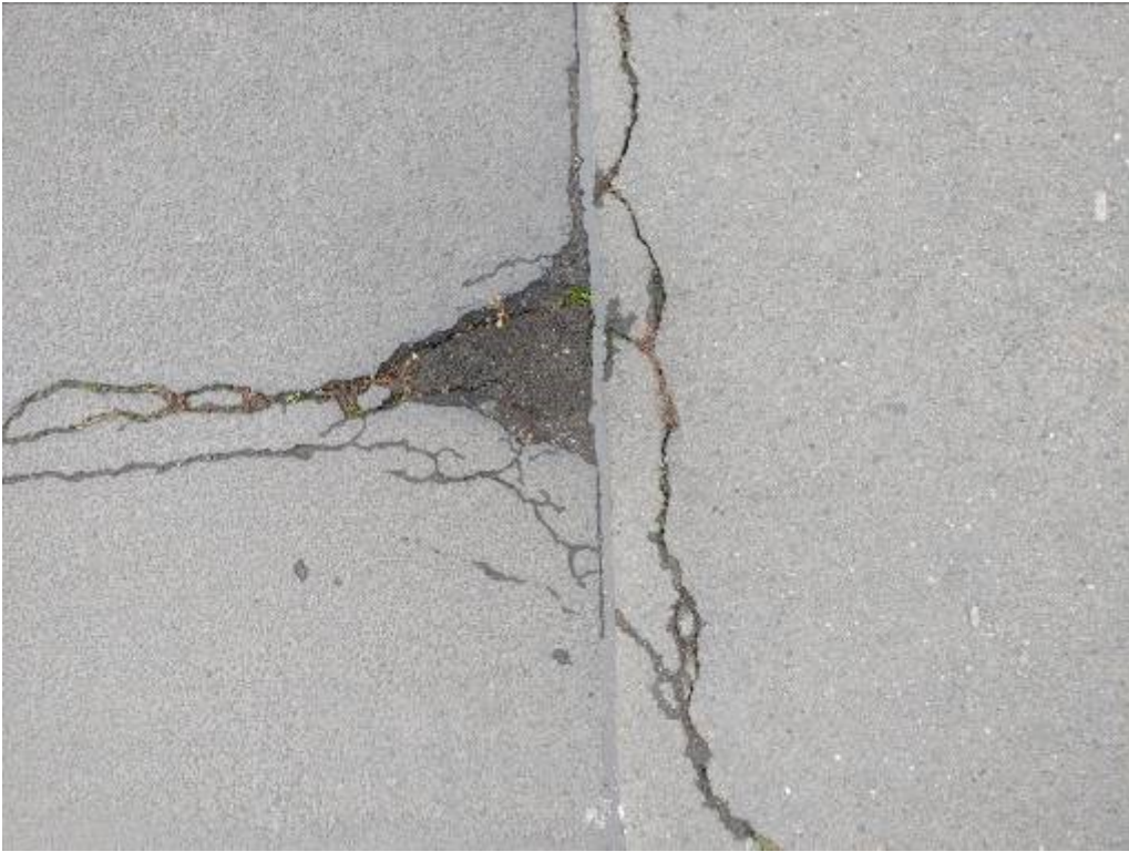
Ulrichstraße + Altmünsterstraße