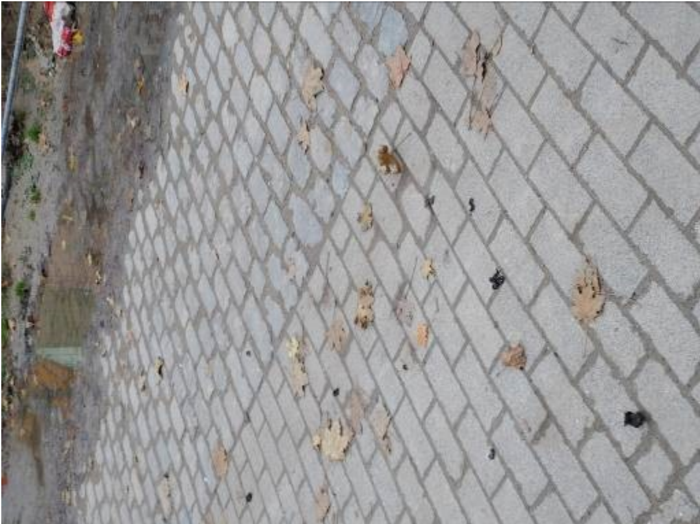
An der Kirchenpforte Höhe Hausnummer 1 + 3