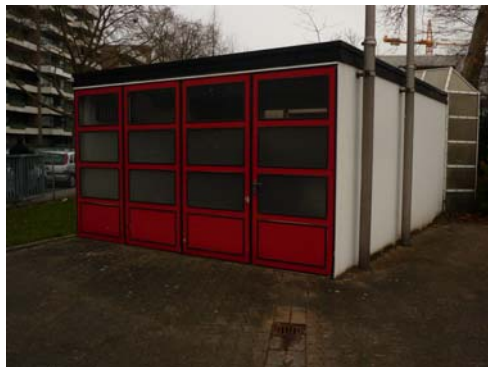
Abb. 7_Ablauf als Oberflächenentwässerung des Stauraums vor Bootshalle

Die Oberflächenentwässerung erfolgt durch einen Ablauf im vorderen Drittel des Stauraumes. Entsprechende Gefälle wurden ausgebildet.