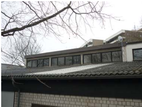
Abb. 16_Dachfläche; Ausbesserungsstellen

bereits mehrfach ausgebessert (siehe Abb. 16). Der Bereich der Attika ist mit Faserzementplatten verkleidet.