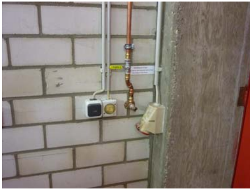
Abb. 27_Starkstromanschluss Fahrzeughalle