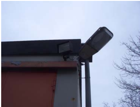
Abb. 5_ Beleuchtung des Stauraums und der Stellplätze

Generell ist eine Beleuchtung für die Stellplätze und den Stauraum vorhanden. Die Beleuchtungsstärke ist jedoch nicht ausreichend.