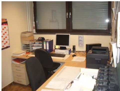
Abb. 9_Verstelltes Fenster im Büro des Wehrführers

Die nutzbare Breite der Fluchtwege ist nur eingeschränkt verfügbar. Der notwendige Flur muss frei von Brandlasten gehalten werden. Offene Garderoben sind nicht zulässig. Das Fenster im Wehrleiterbüro ist durch Möbel verstellt (siehe Abb. 9).