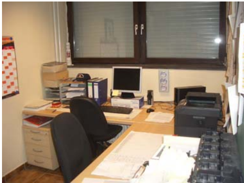
Abb. 31_Büro des Wehrführers