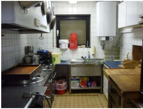
Abb. 33_ Küche