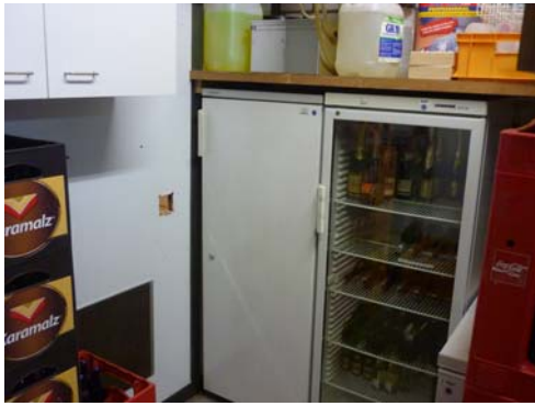
Abb. 36_Getränkelager des Fördervereins