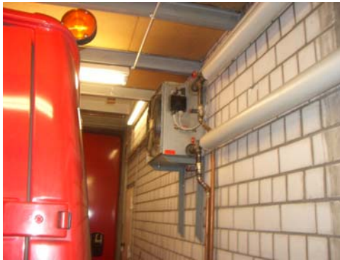
Abb. 41_ unterschrittene Mindestdurchfahrbreite

Der Abstand zwischen Fahrzeug und Wand liegt größtenteils unter dem Mindestmaß von 0,5 m. Der Mindestabstand zwischen Fahrzeug und Decke von 0,2 m wird eingehalten. Die Durchfahrtsbreite beträgt 3,50 m und erfüllt die vorgeschriebenen 3,5 m.