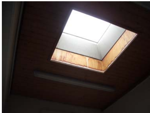
Abb. 20_Fehlerhafter Anschluss Dachkuppel

Ein fehlerhafter Anschluss konnten lediglich an der Dachkuppel festgestellt werden. Hier ist ein Wassereintritt feststellbar.