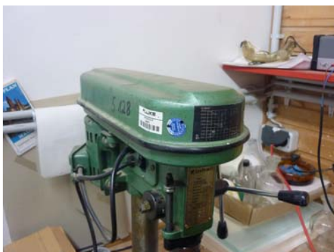
Abb. 40_ Prüfsiegel Maschine