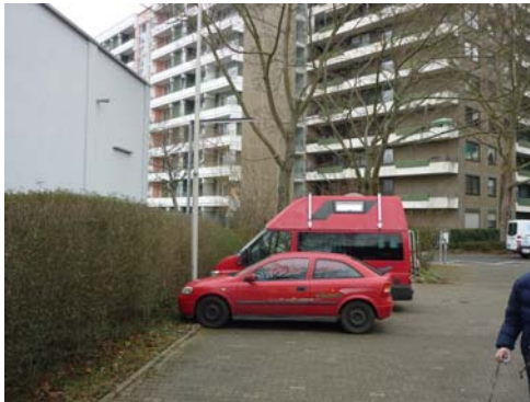
Abb. 4_ Stellplätze für Einsatzkräfte seitlich des Stauraums