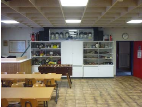
Abb. 10_Einfache Holztür zwischen Schulungsraum und Flur

Die Innentüren zwischen notwendigem Flur und den Aufenthaltsräumen oder Lagern sind ausschließlich einfache Holztüren (siehe Abb. 10) mit sehr geringer Brandschutzwirkung und entsprechen nicht der LBauO Rheinland-Pfalz. Einzig zwischen Fahrzeughalle und dem notwendigem Flur wurde eine Brandschutztür verbaut. Bei einem Brand innerhalb des Gebäudes können sich Rauch und Feuer nahezu ungehindert ausbreiten.