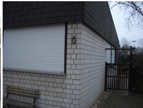
Abb. 17_Attika, Fassade mit Faserzementplatten