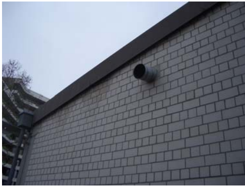
Abb. 12_ Mauerwerk