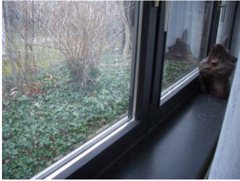
Abb. 15_dicht schließende Holzprofile