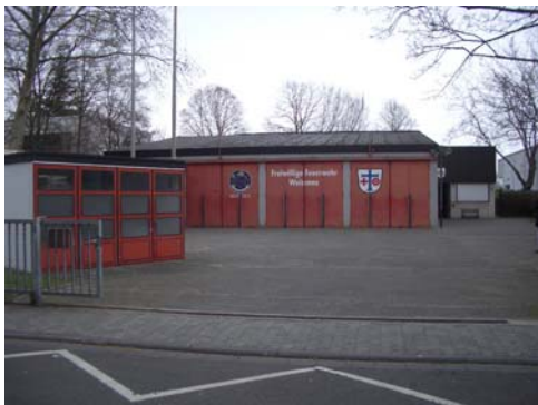
Abb. 8_ Stauraum als Übungshof nutzbar

Ein Unterflurhydrant ist vorhanden. Ein Oberflurhydrant existiert nicht.