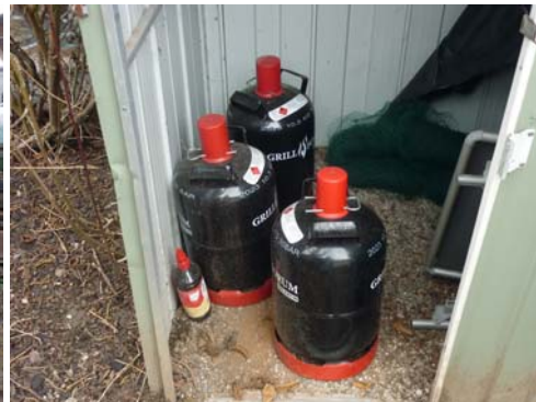
Abb. 37_Lagerung von Druckgasen in Gartenhütte Abb. 38_Lagerung von Druckgasen in Gartenhütte