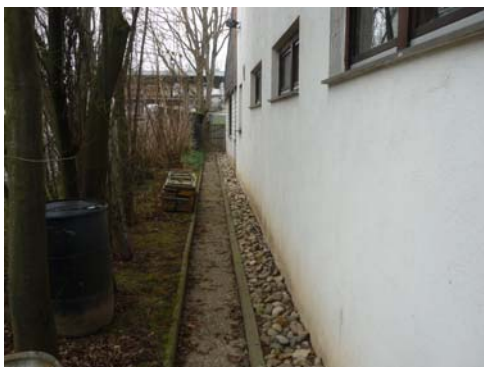
Abb. 13_ Verputzte Fassade

Der optische Eindruck der Fassade ist gut. Der verputzte Teil der Fassade muß mittelfristig neu gestrichen werden.