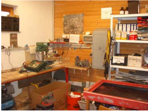
Abb. 39_ Werkstatt