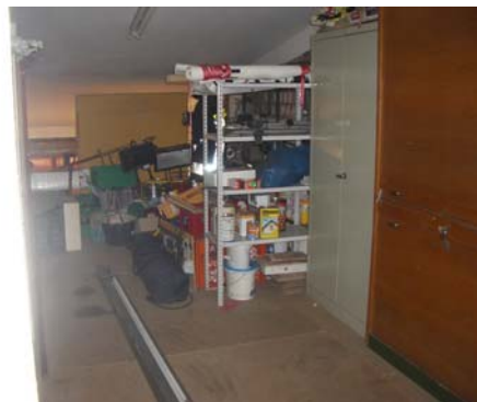
Abb. 34_ Fehlende Lagerkapazitäten führt zur Lagerung von Materialien in der Fahrzeughalle Abb. 35_ provisorischer Lagerraum im Obergeschoß