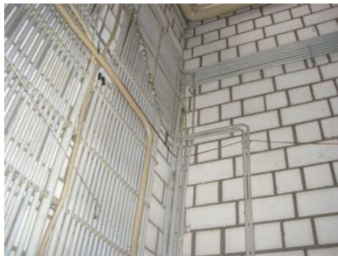
Abb. 26_ Leitungsführung

Netz- bzw. Leitungsführung hauptsächlich in Leitungskanälen über Mauerwerk bzw. Putz verlegt.