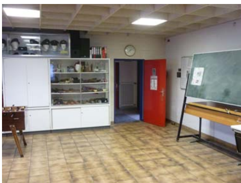
Abb. 22_ Fliesenboden im Schulungsraum

Der Bodenaufbau ist nutzungsgerecht, leicht zu reinigen und hat kaum Beschädigungen. Der Boden ist eben, Fliesen sind fest verlegt und haben keine Hohlstellen. Der Abnutzungsgrad ist gering (siehe Abb. 22). Die Fliesen sind älter als 20 Jahre.