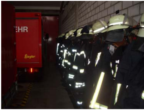
Abb. 30_Umkleidebereich in der Fahrzeughalle