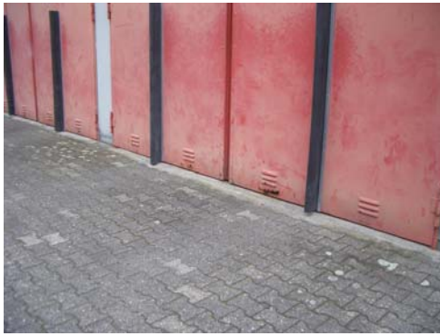
Abb. 41_Beschädigte Stahtore