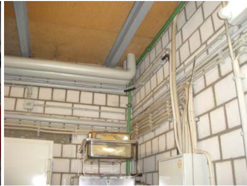
Abb. 25_Nebenverteilung vor der Küche