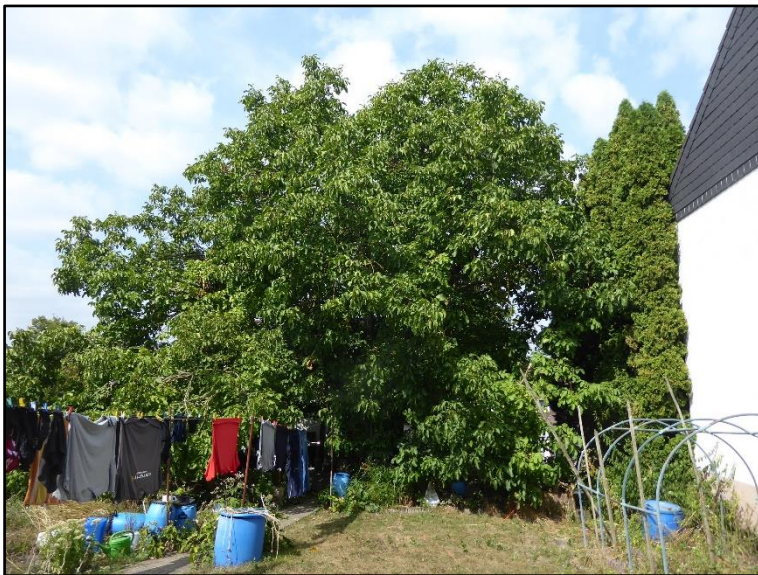
Abbildung 3: Walnussbaum Nr. 104 mit einem Stammumfang von 173 cm und breit ausgebildeter Krone.