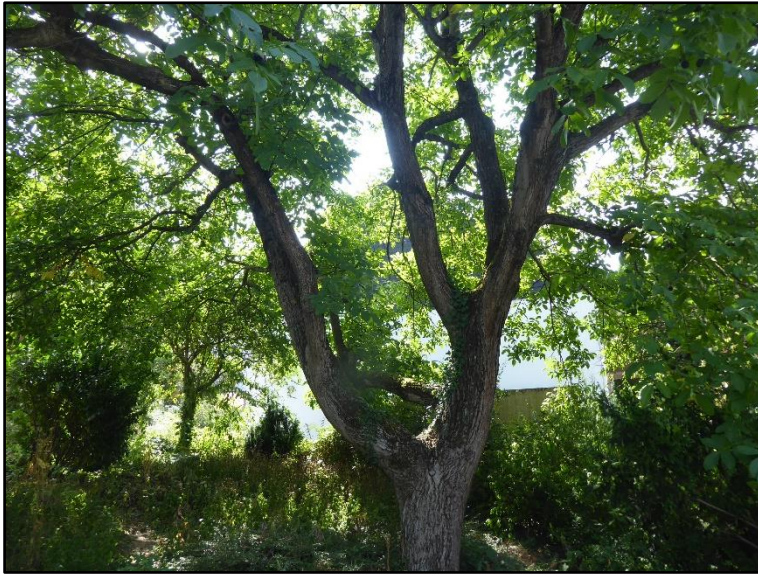
Abbildung 2: Walnussbaum Nr. 11 mit einem Stammumfang von 250 cm.