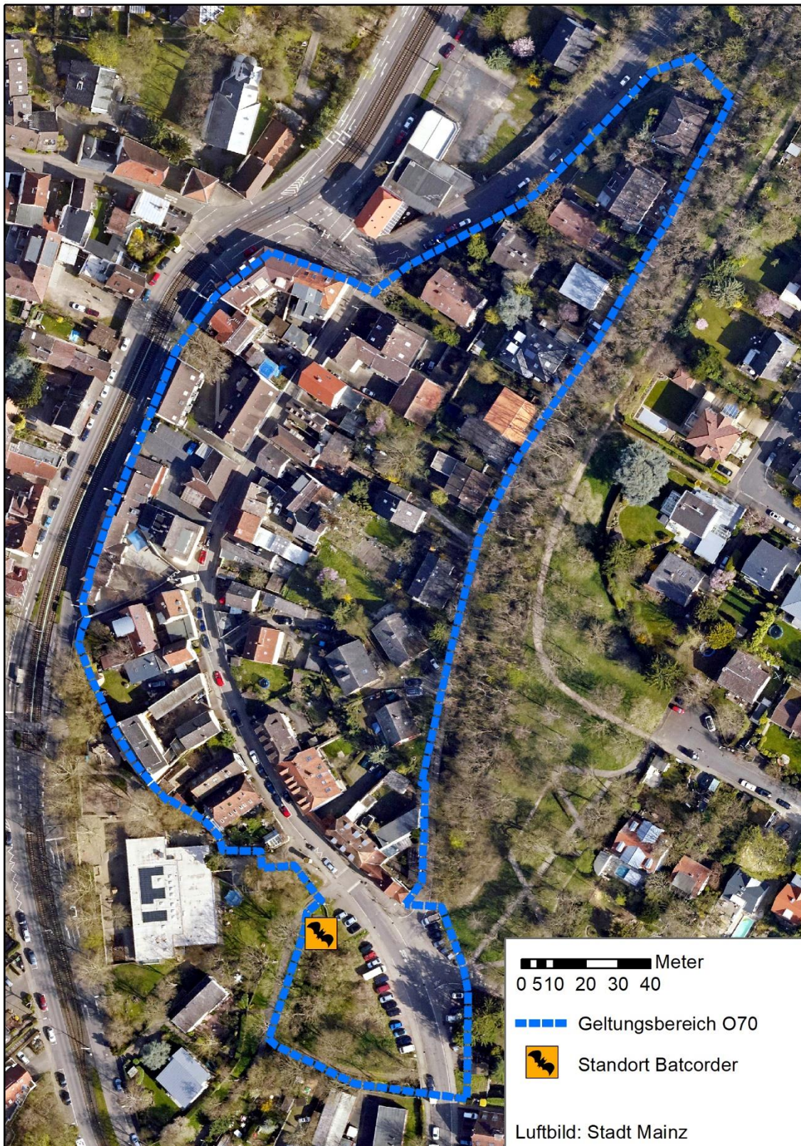
Abbildung 1: Untersuchungsgebiet „Milchpfad“, eigene Darstellung.