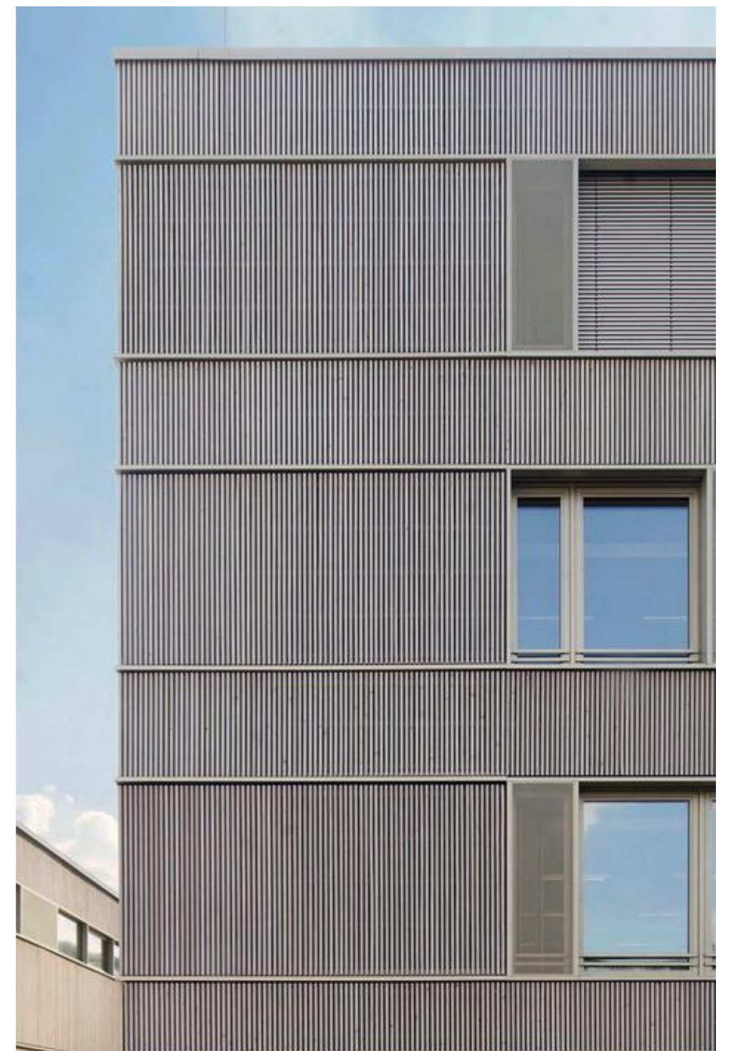
Beispielprojekt Holzlamellenfassade Dahmannschule Frankfurt Architekt: Birk Heilmeyer und Frenzel Gesellschaft von Architekten mbH, Stuttgart