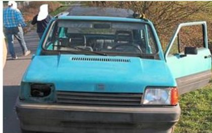
nicht zugelassene Fahrzeuge