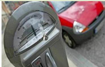
Überwachung Ruhender Verkehr