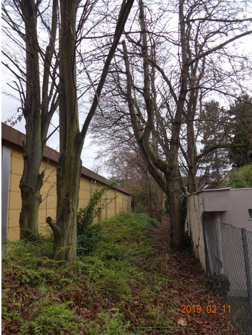
Abbildung 2: Baumbestand nördlich der Tennishalle (Blick von Osten)

dung 3). Im Westen befindet sich ein stark bewegtes Gelände. Der Geltungsbereich erweist sich als stark anthropogen überprägt. An der geringen Arten- und Strukturvielfalt lässt sich ablesen, dass die genetische und ökosystemare Vielfalt eine untergeordnete Rolle spielt.