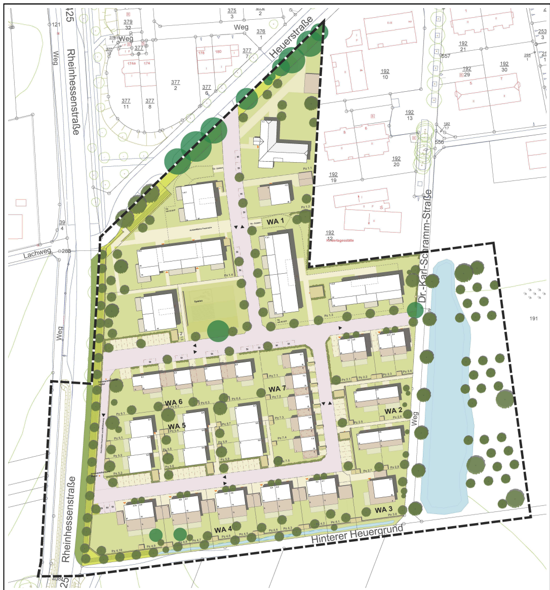
Abbildung 5: Städtebauliches Konzept als Grundlage für den Bebauungsplan "He 117".

Auf dieser Grundlage erfolgte dann im Zuge des Bauleitplanverfahrens nochmals eine Verfeinerung des städtebaulichen Konzeptes. Aus Gründen der hohen Nachfrage nach Reihenhaustypen wurde die Baustruktur im zentralen Teil des Plangebiets verändert und weitere Reihenhaustypen in das städtebauliche Grundkonzept aufgenommen. Darüber hinaus wurden die Planungen des (privaten und öffentlichen) ruhenden Verkehrs überarbeitet. Diese Planung bildet nunmehr die Grundlage für den Bebauungsplan "Am Weidezehnten (He 117)".