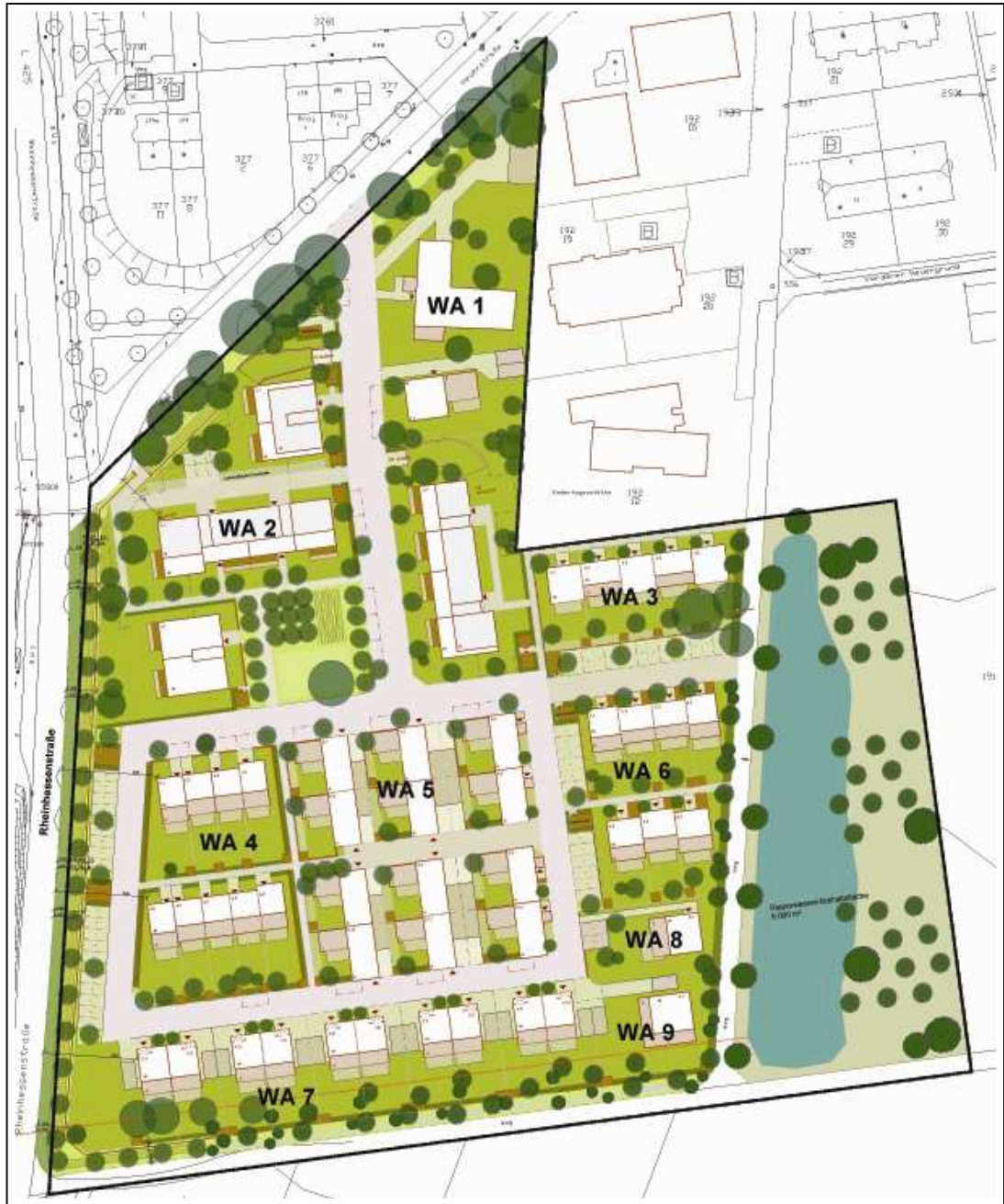
Abbildung 4: Überarbeiteter Planstand mit Berücksichtigung der 20 m- Bauverbotszone sowie der im Osten arrondierten Fläche für Versickerung und Ortsrandeingrünung.

mals zu überplanen. Die Erschließung des Plangebiets kann nun von Norden von der Straße "Heuergrund" aus in das Plangebiet erfolgen. Die zuvor geplante Stichstraße mit einem Anschluss an die Rheinhessenstraße (L 425) kann entfallen. Dies hat den Vorteil, dass der erforderliche Lärmschutz entlang der Rheinhessenstraße nicht geöffnet bzw. unterbrochen werden muss und hierdurch ein noch höherer Lärmeintrag durch Verkehrslärm in das geplante Wohngebiet vermieden werden kann. Zudem wird die nördlich an das ursprünglich kleinere Plangebiet angrenzende Maschinenhalle des landwirtschaftlichen Betriebs abgerissen. Damit entfällt eine weitere potenzielle Lärmquelle, die die spätere Wohnnutzung unter Umständen beeinträchtigt hätte.