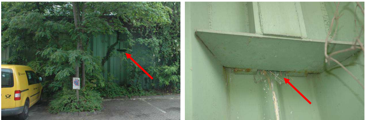
Abbildung 2: Stützwand der Wallstraße am Westrand des Plangebietes als Stahlplatten mit Vogelnest hinter vorstehenden Metallteilen

Der Baumbestand erwies sich als jung und dünnstämmig, ohne jegliche Stammsausfaltungen. Auch wurden keine Vogelnester in den Baumkronen oder Gebüschern entdeckt. In der Stützwand der Wallstraße am Westrand des Planungsgebietes fanden sich aber mehrere Vogelnester (vermutlich von Haussperlingen) hinter vorstehenden Metallteilen (s. Abb. 2 u. 3).