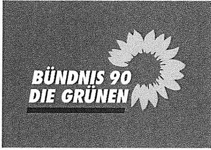
Bündnis 90/Die Grünen im Ortsbeirat Mainz-Neustadt