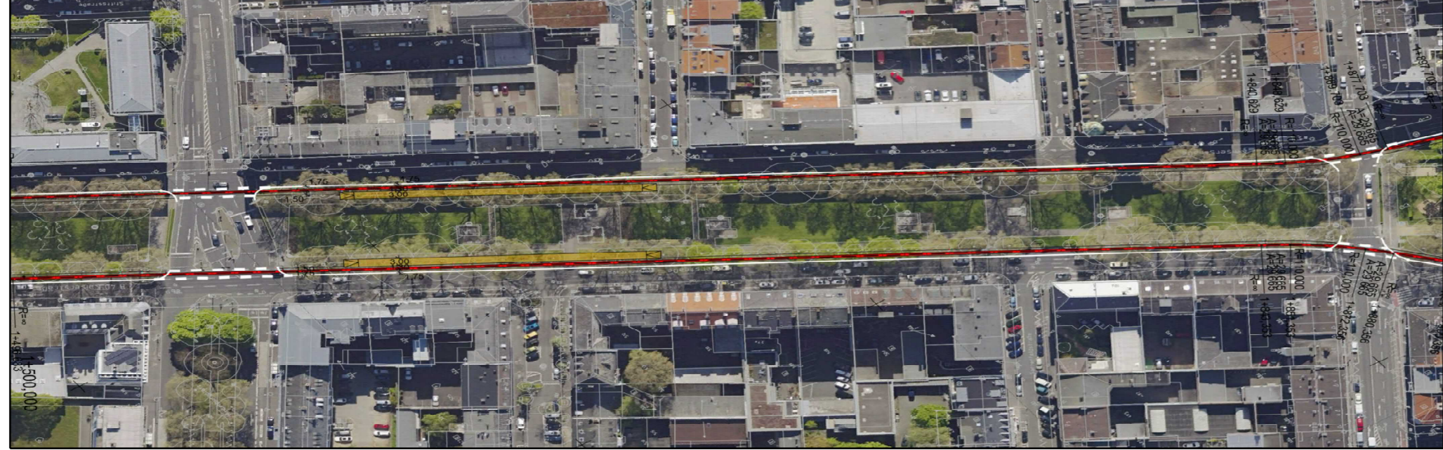
Alternative: Linienführung am linken Fahrbahnrand mit Haltestelle Außenbahnsteig in Grünanlage Darstellung nur nachrichtlich - Planung nicht genehmigungsfähig!