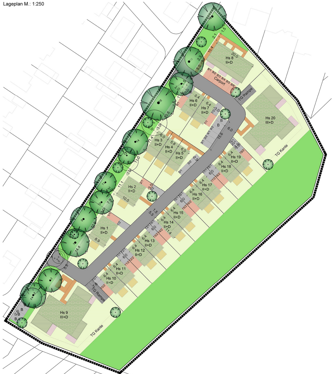
Städtebauliches Konzept zum Bebauungsplan "W 103", Quelle: Wilma Wohnen Süd GmbH, 06/2016