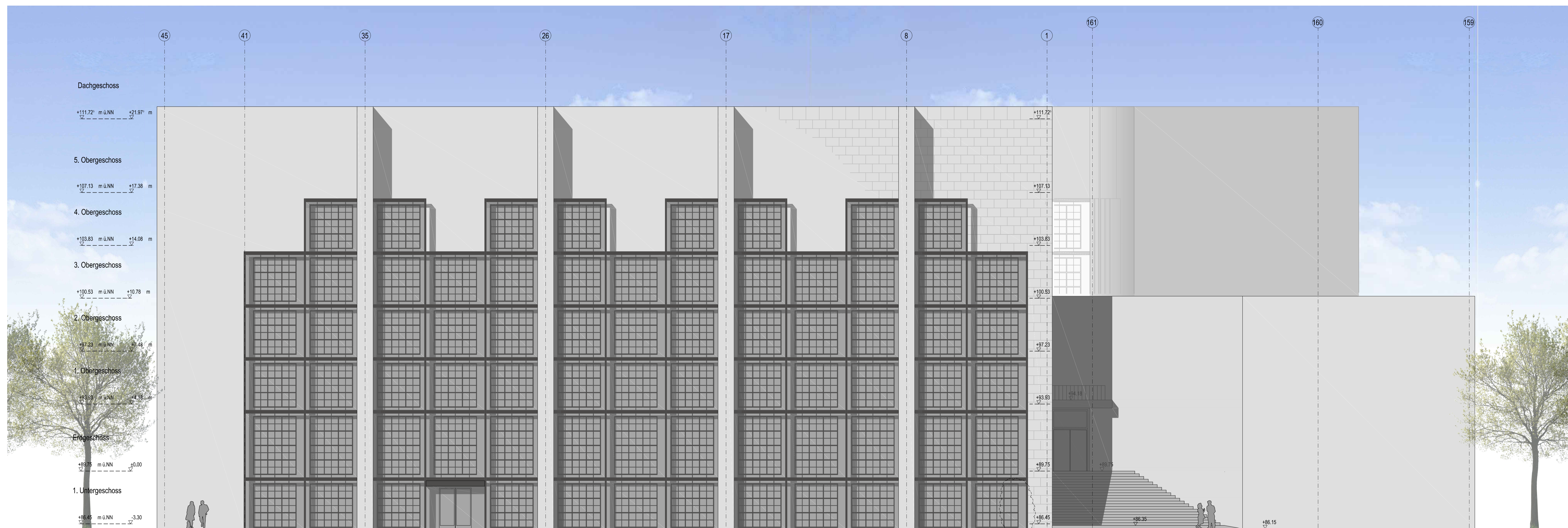
Ansicht Süd - mit Sonnengitter