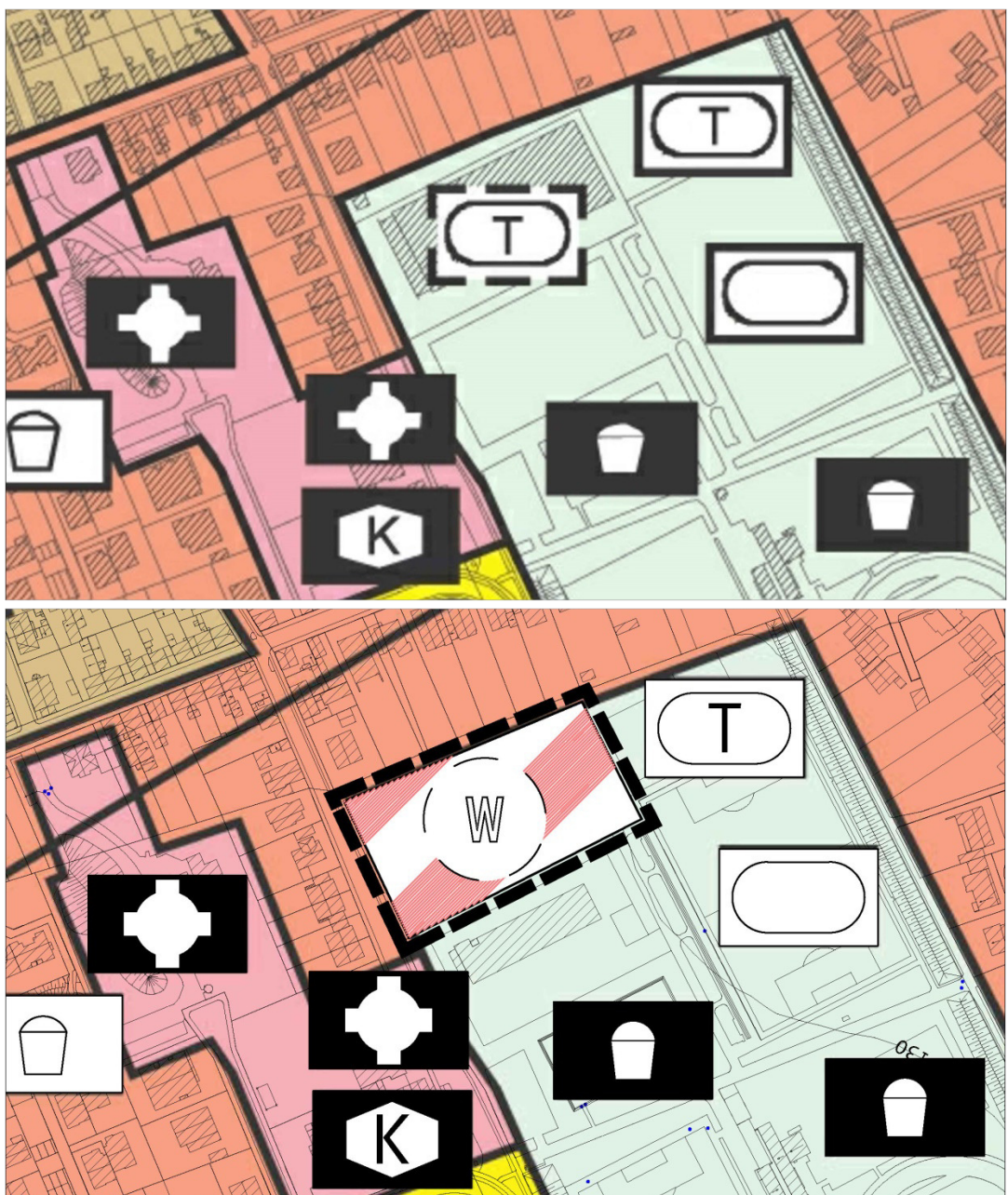
Berichtigung FNP im Bereich des Bebauungsplanes "Wohnquartier Albert-Stohr-Straße (B 166)"

Die nunmehr vorgesehene Wohnnutzung entspricht nicht den Darstellungen des Flächennutzungsplanes. Dieser muss für den Bereich des Plangebiets entsprechend angepasst, bzw. berichtigt werden.