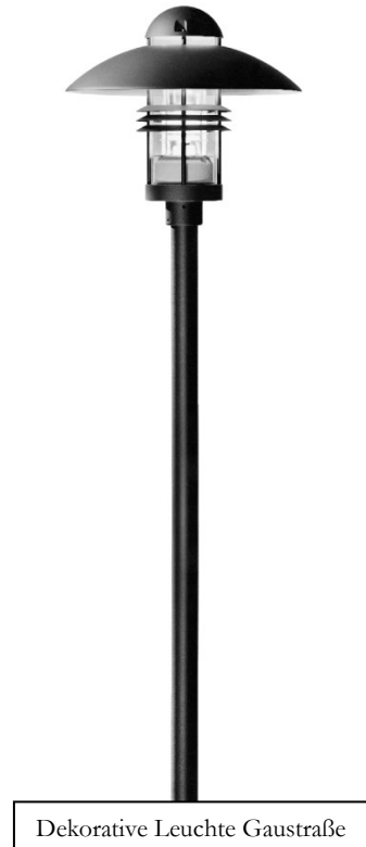
Dekorative Leuchte Gaustraße