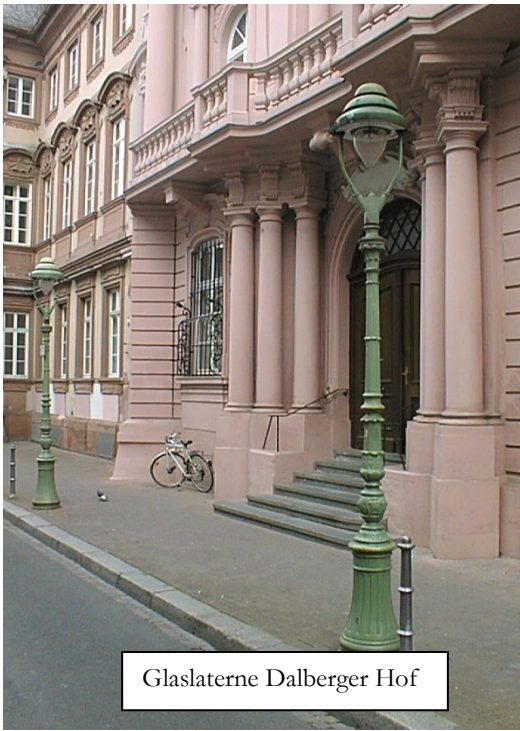
Glaslaterne Dalberger Hof