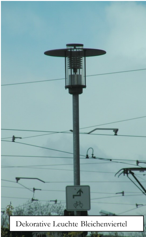
Dekorative Leuchte Bleichenviertel