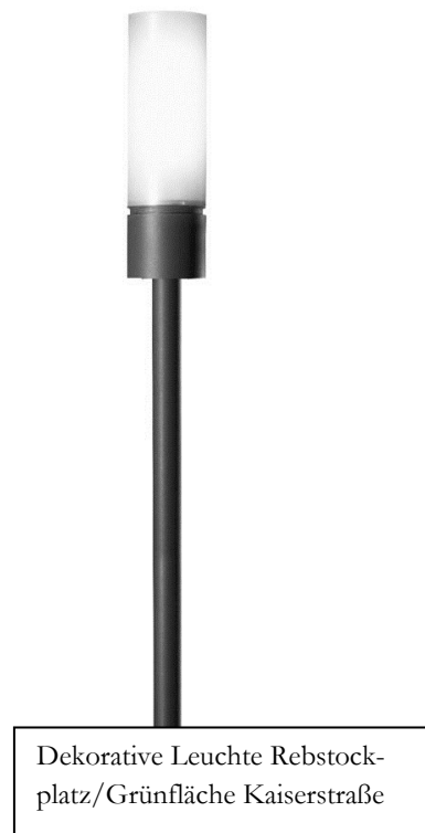
Dekorative Leuchte Rebstock- platz/Grünfläche Kaiserstraße