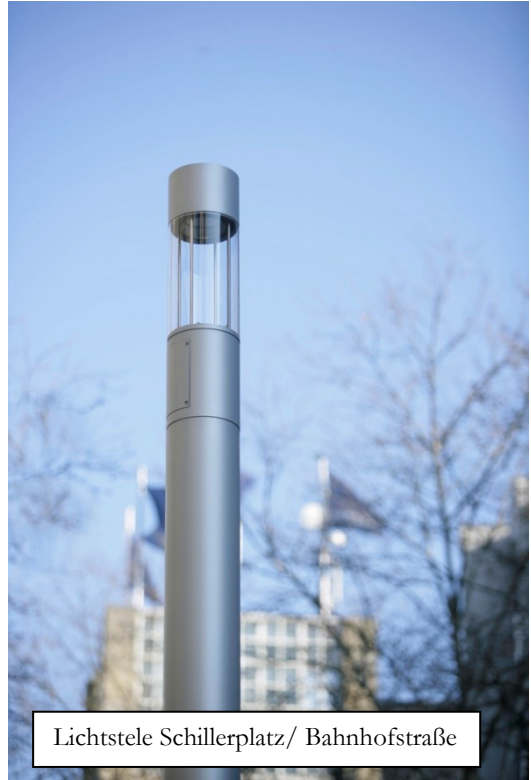
Lichtstele Schillerplatz/ Bahnhofstraße