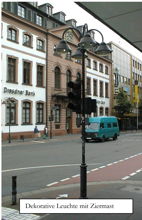
Dekorative Leuchte mit Ziermast