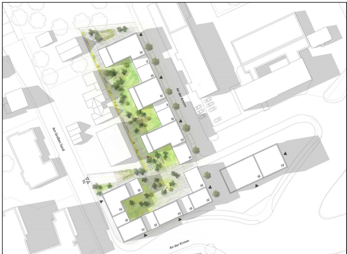
Abbildung 1: Städtebauliches Konzept.

Öffentliche Flächen zur Erschließung der Neubebauung sind im Umfeld bereits ausreichend vorhanden. Ergänzende Erschließungsflächen sind daher nicht mehr erforderlich.