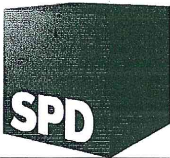
Sozialdemokratische Fraktion im Ortsbeirat Mainz-Neustadt