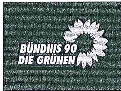
Bündnis 90/Die Grünen im Ortsbeirat Mainz-Neustadt