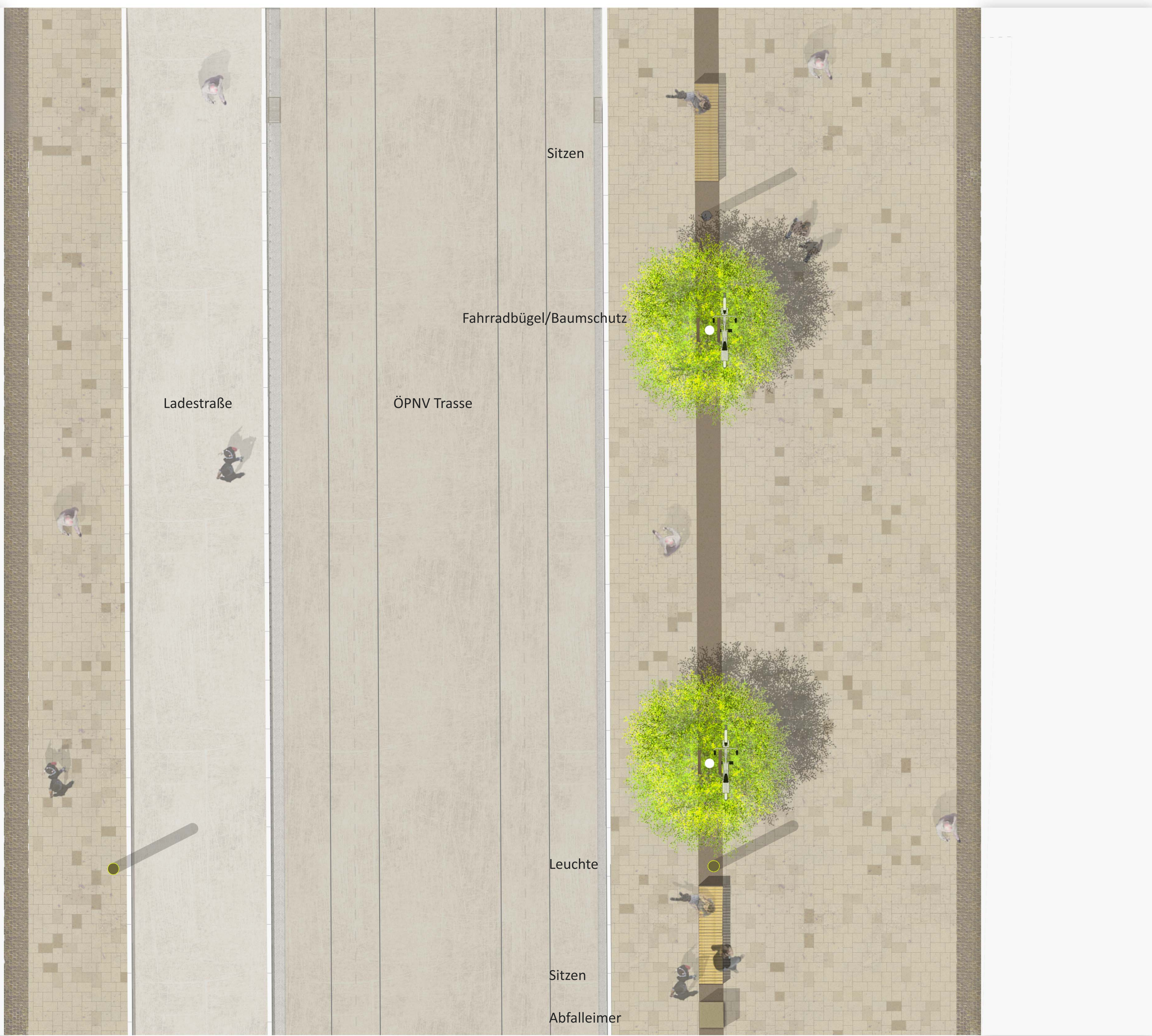
Lageplan 1:50 Bereich Ladestraße