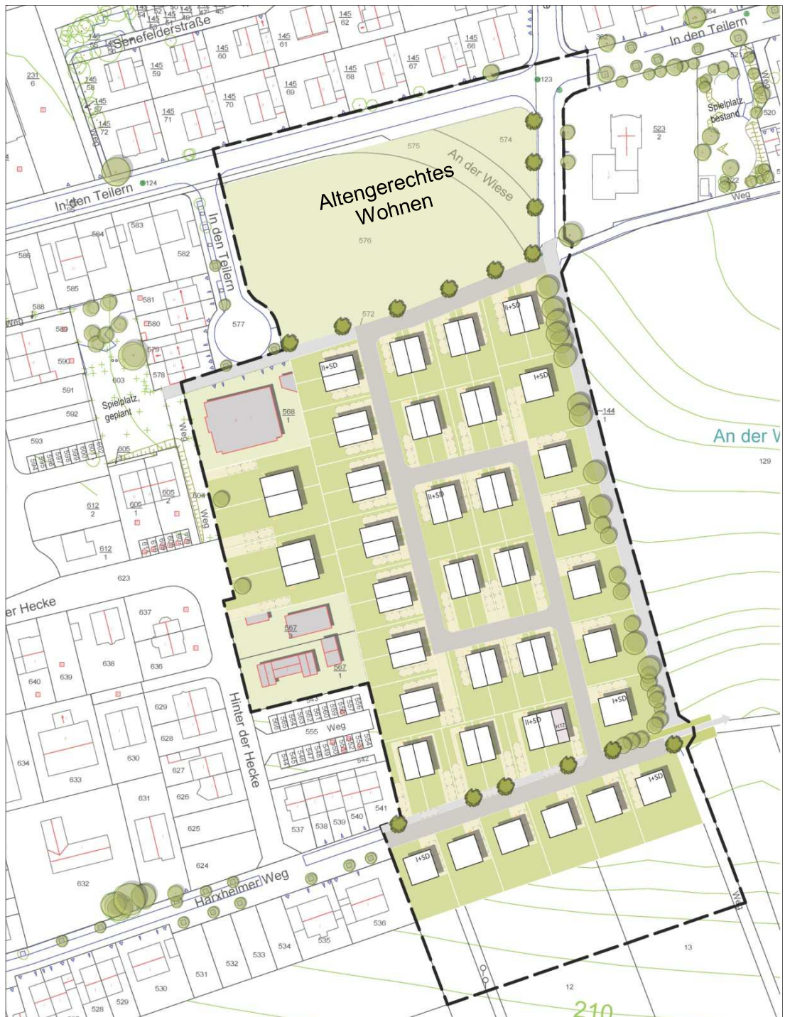
Abbildung 1: Städtebauliches Konzept.

Die Anzahl der Vollgeschosse staffelt sich nach Osten hin ab. Als einheitliche Dachform ist in Anlehnung an den westlich bereits realisierten Bestands und die ortstypische Bebauungsstruktur eine Satteldachform vorgesehen.