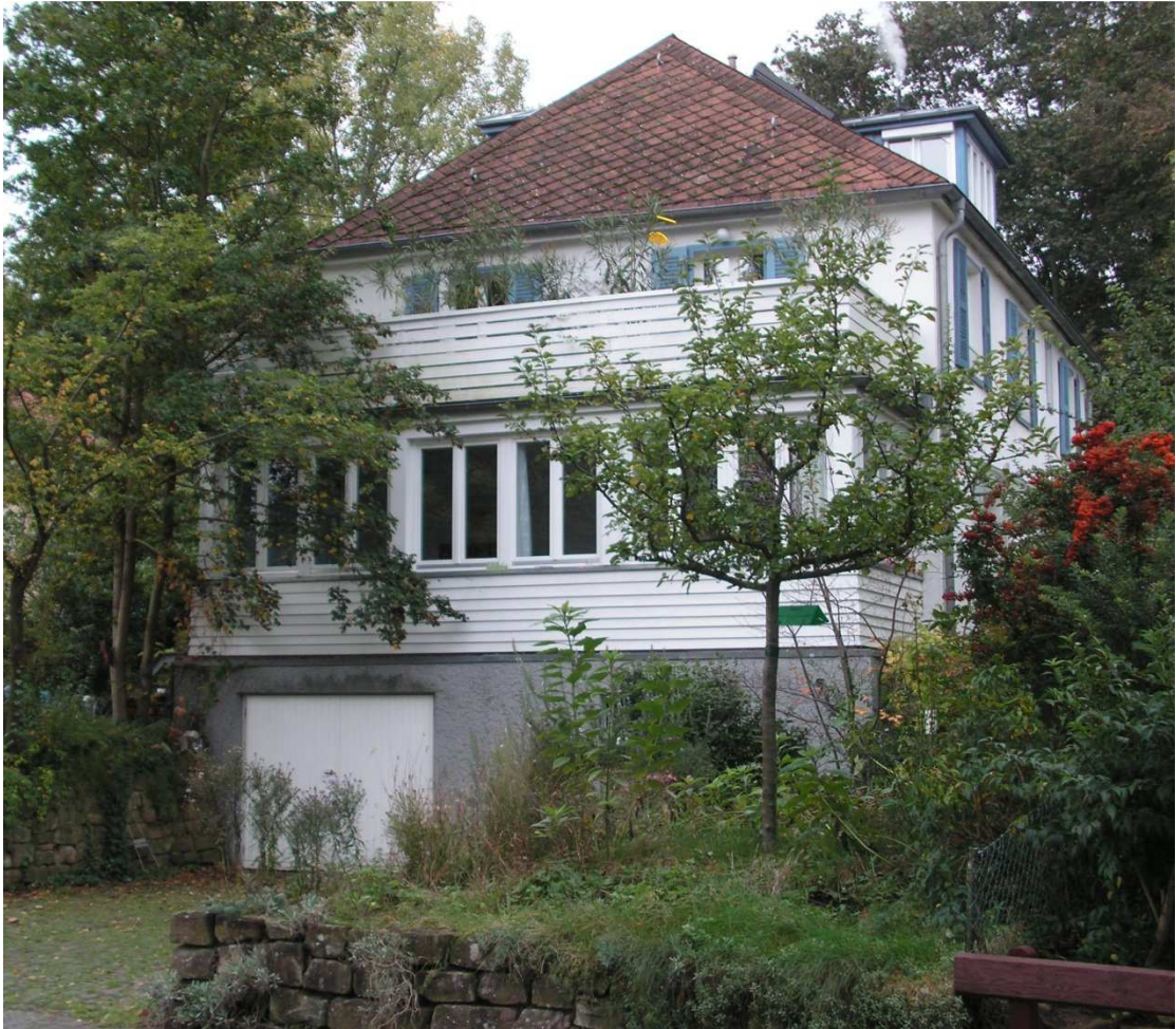
Haustyp "Emilie" (Geländeversprung)

bauliche Situation gilt weitgehend auch für die übrigen bebauten Flächen des Plangebietes.